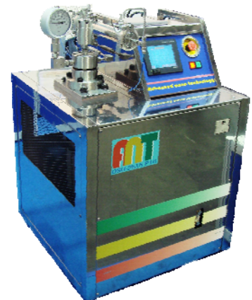
『キャビテーションミル』